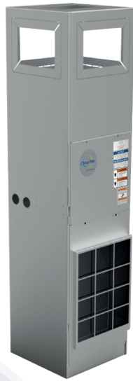
PIE DE HUELLA