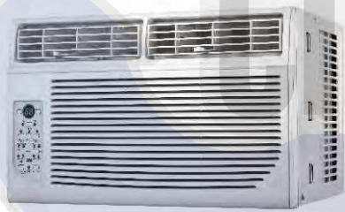
MAW05CIESBW y MAW08CIESBW