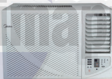
MAW12CIESBW y MAW12C2ESBW