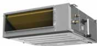
Fan & Coil