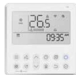
3. Termostato Wi-Fi Modelo: KJR-120N Conexión: Puerto CN40